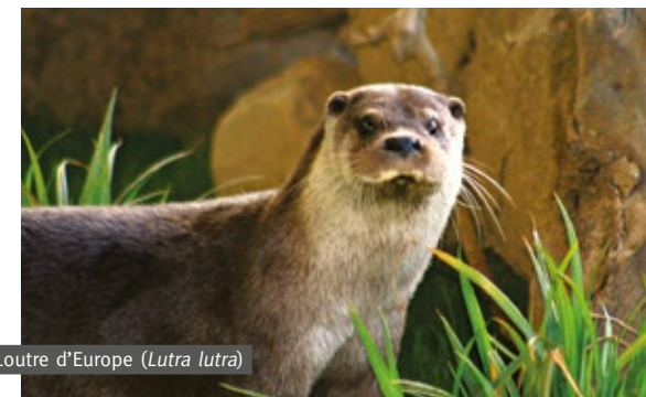
Loutre d'Europe ( Lutra lutra )

Les loutres de mer bénéficient d'un espace totalement marin composé de deux bassins, dont les profondeurs varient entre 4 et 5 m, pour un volume d'environ 180 m 3 d'eau de mer. C'est dans cet espace recréant l'environnement rocheux d'une grève californienne qu'évoluent Pukiq, Matchaq et Tangiq.