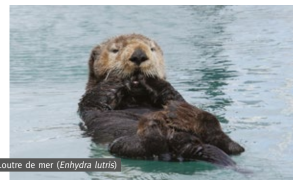
Loutre de mer ( Enhydra lutris )